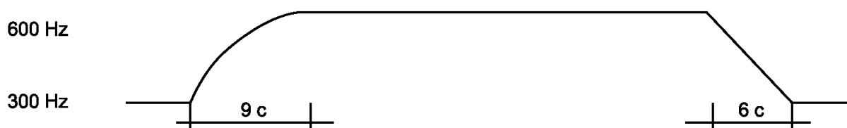
Рисунок 1 - Диаграмма однотонального режима звучания

- в однотональном режиме в соответствии с рисунком 1;